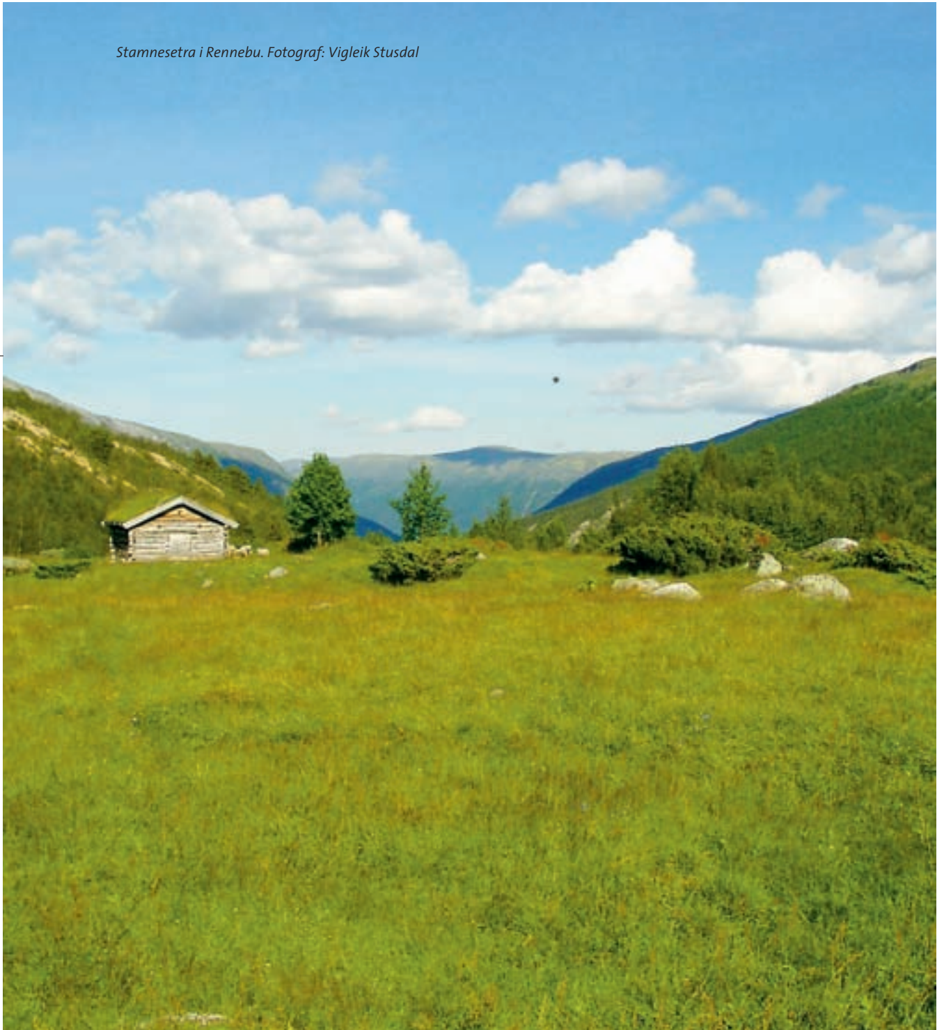
Stamnesetra i Rennebu.