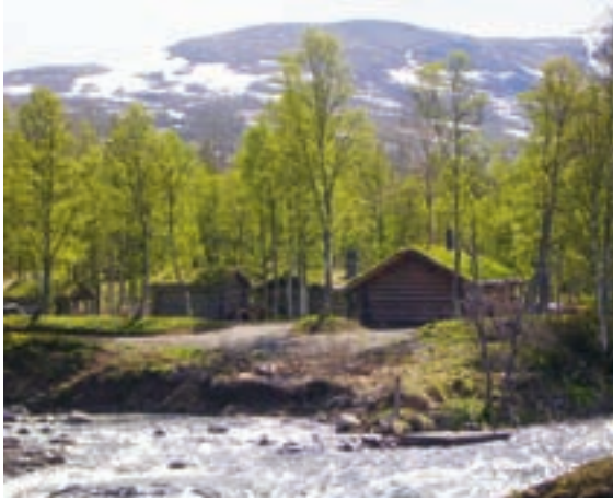
Museumssetra i Budal, Midtre Gauldal kommune