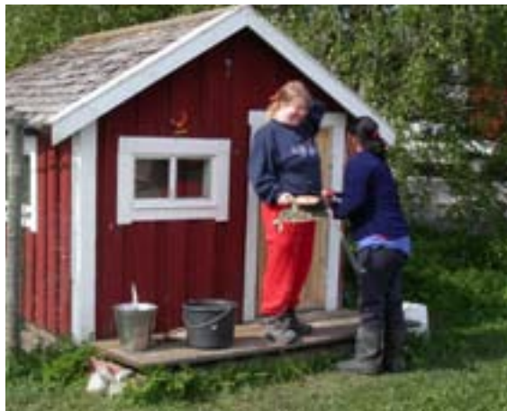
Brukare/deltagare i projektet på Haxängs gård jobbar på.

Mocka, mjölka, stängsla och röja. Haxängs gård i Jämtland har fått hjälp av fyra entusiaster från MICA, Människan i Centrum – Arbete, Östersund kommun. Grön omsorg har gjort sitt inträde i Sverige och Jämtland via Interreg-projektet Gränsprängande omsorg.